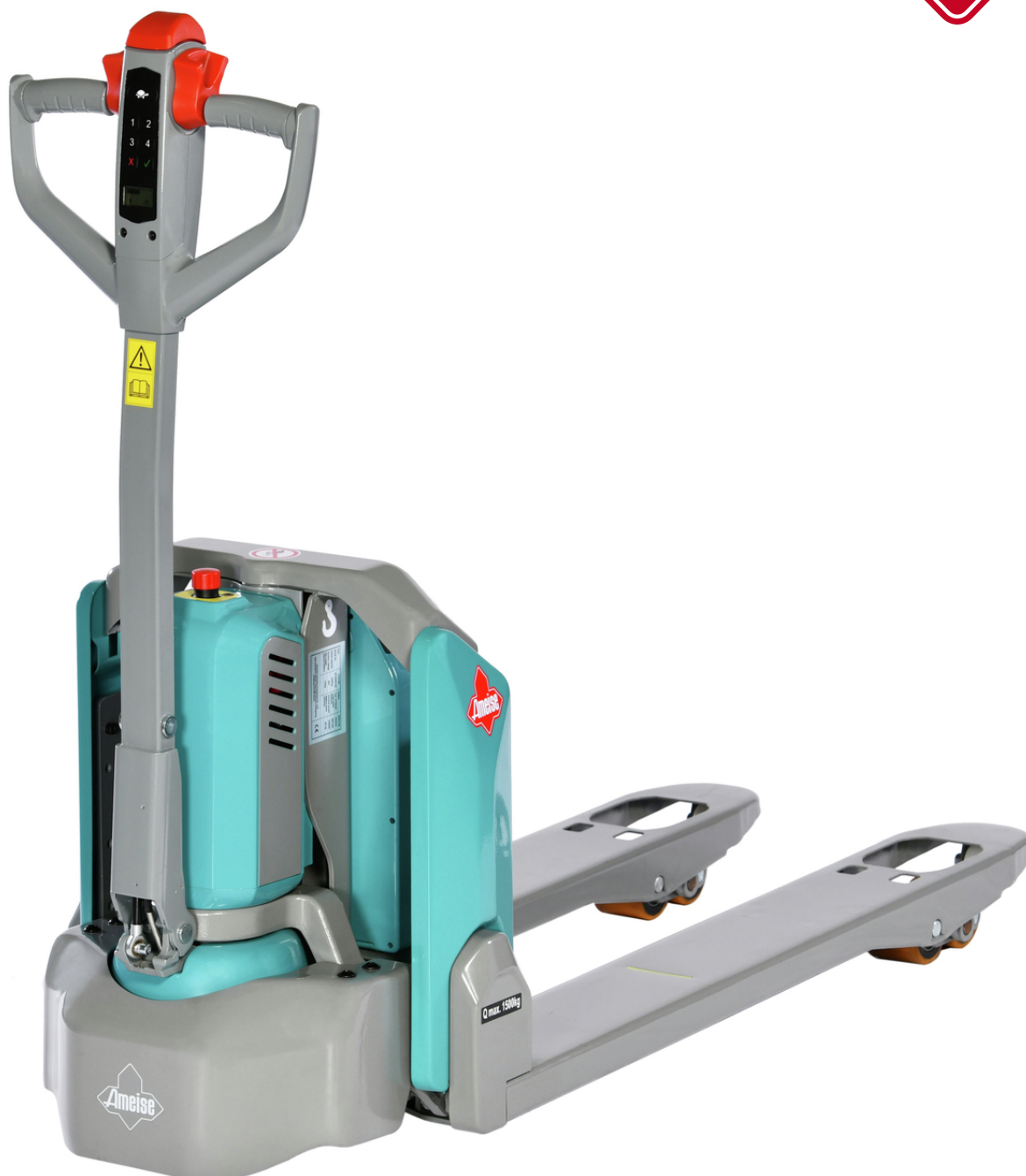
Ameise PTE 1.5 Porta-paletes elétrico (1500 kg)